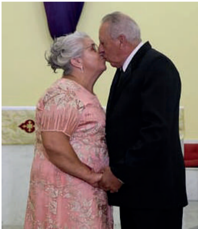
Finalmente, a hora do beijo.