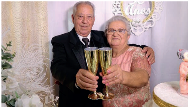
O casal brinda o especial momento