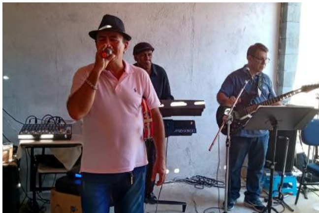
A animação da festa ficou por conta da Banda Musical Flávio Oliveira.