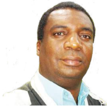
Quinzinho: Editor de Imagens