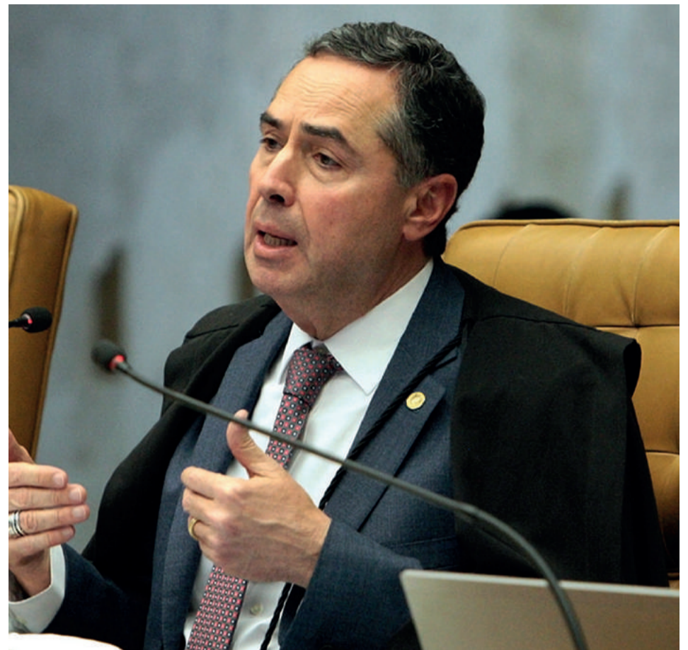
Presidência do TSE, Ministro Luís Roberto Barroso

Ao tomar posse na presidência do TSE, em 25 de maio, o ministro Luís Roberto Barroso disse que somente haveria adiamento das eleições — com a consequente prorrogação dos mandatos dos atuais ocupantes dos cargos — em caráter especialíssimo.