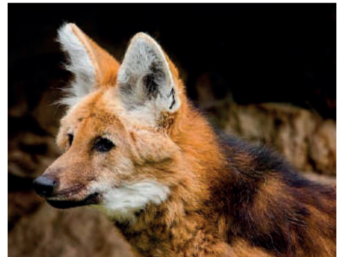
“O lobo-guará Escolhido para ilustrar a cédula de R$ 200

Informações para a imprensa Fundação Grupo Boticário Tamer Comunicação ( www.tamer.com.br ) Claudia Leone – 11 3031-2388 - ramal 247 – 11 99482-7556 ( claudialeone@tamer.com.br ) Renato Santana – 11 3031-2388 - ramal 225 – 11 99996-6388 ( renato.santana@tamer.com.br ) Direção de Núcleo: Ana Claudia Bellintane – 11 3031-2388 - ramal 238 – 11 998495628 ( anaclaudia@tamer.com.br )