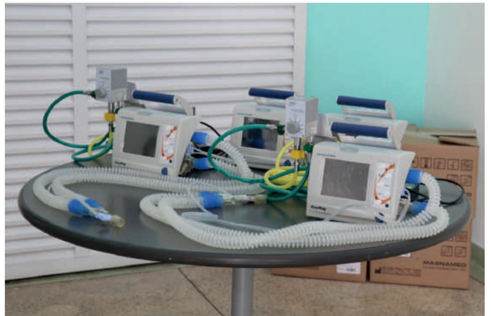
No total, a região do Alto Tietê foi contemplada com 14 novos respiradores para reforçar a saúde dos municípios no combate à COVID-19.