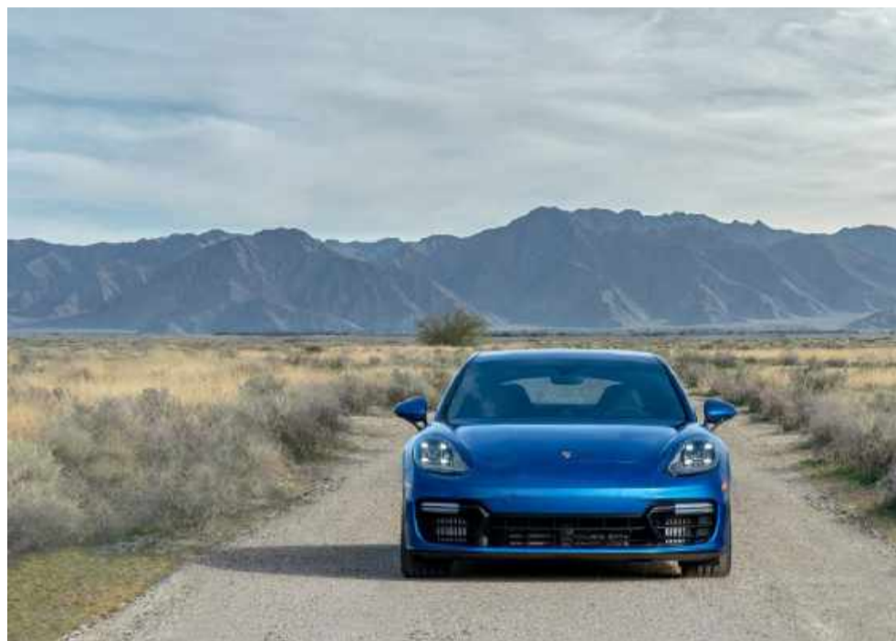
PORSCHE PANAMERA GTS

certamente serão mantidas na segunda fase dessa segunda geração, que será apresentada em Stuttgart ainda neste mês de agosto