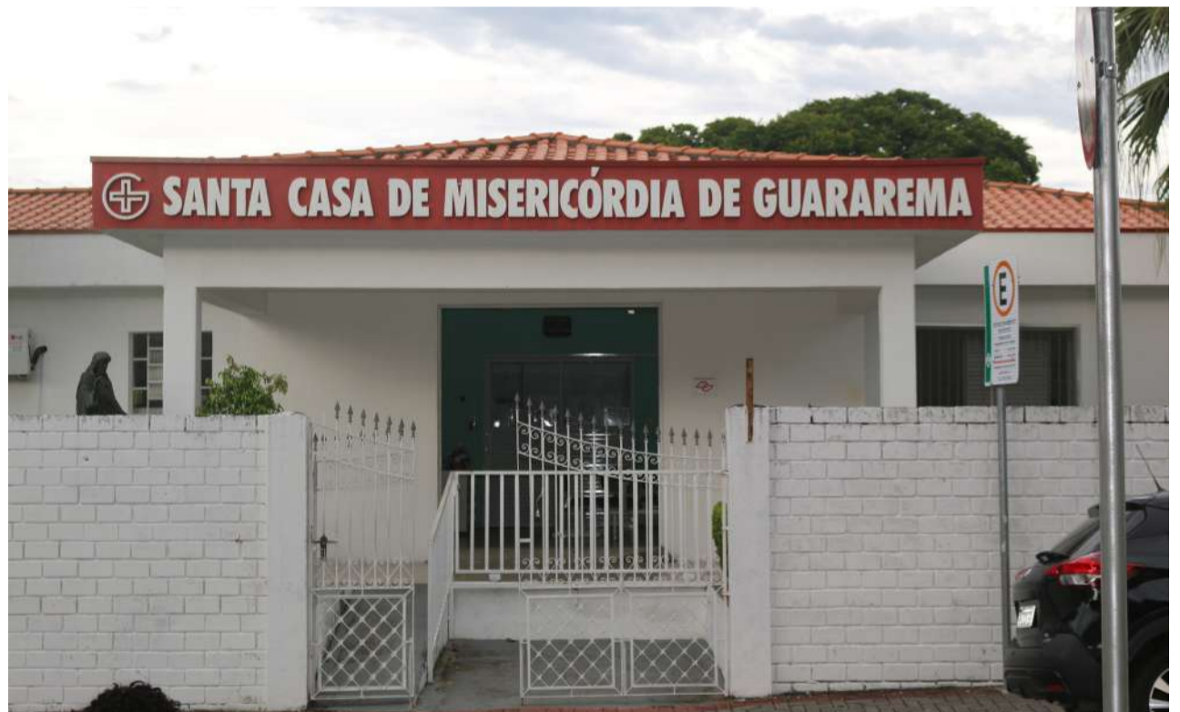
Santa Casa de Misericórdia - Rua Dr. Silva Pinto, nº 177 – Centro : 24 horas