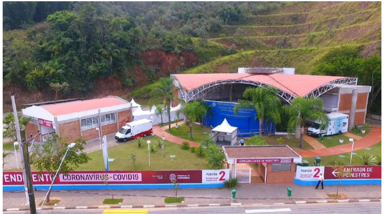
Instalado em Guararema em 15 de abril, o CDA realizou cerca de 1180 atendimentos, 870 coletas de exames (swab) e 7650 procedimentos, entre exames laboratoriais, raio x, eletrocardiograma, medicação, entre outros,