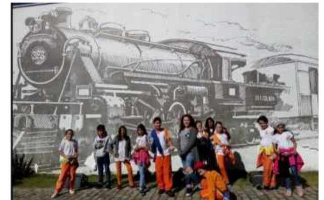
Alunos do 5º ano da Escola Municipal João Baptista Jungers na Vila de Luís Carlos.