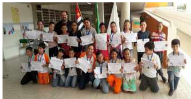
Alunos do 5º ano da Escola Municipal Paulo Ismael dos Santos Sobrinho, premiados na Olimpíada Internacional "Matemática sem Fronteiras".