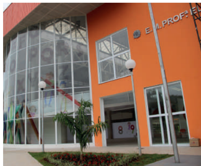
Escola Municipal Eunice Leonor Lopes Prado

das unidades escolares. Fonte: Secretaria Municipal de Educação. .Continua na página 03