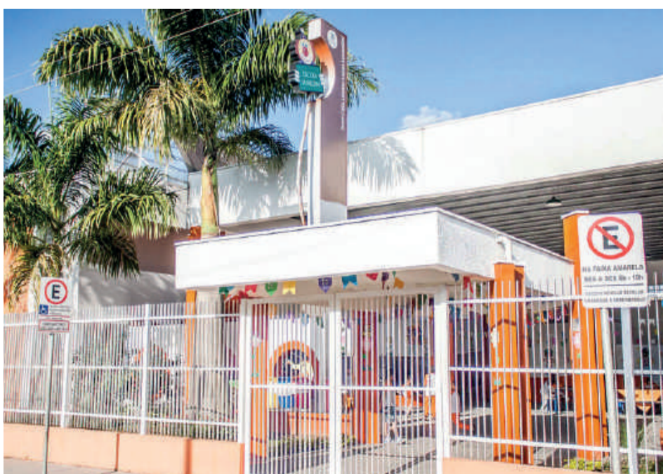
Escola Municipal Célia Leonor Lopes Lunardini