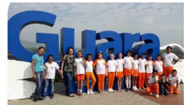
Alunos do 5º ano da Escola Municipal Sylvio Luciano de Campos, durante aula-passeio do Programa "Turismo Sustentável nas Escolas".