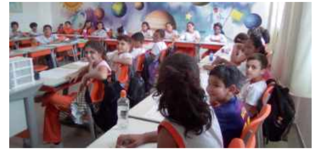
Alunos do 5º ano da Escola Municipal Prof. Dr. Domingos Lerario em sala de aula, espaço de grandes aprendizagens!