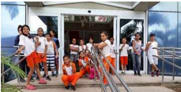
Parte dos alunos dos 5º anos da Escola Municipal José Benedito dos Santos, durante aula-passeio no programa "Embarcando na Estação Literária".