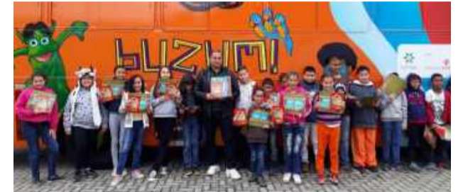
Parte dos alunos dos 5º anos da Escola Municipal José Donizete de Paiva, em dia de Buzum!