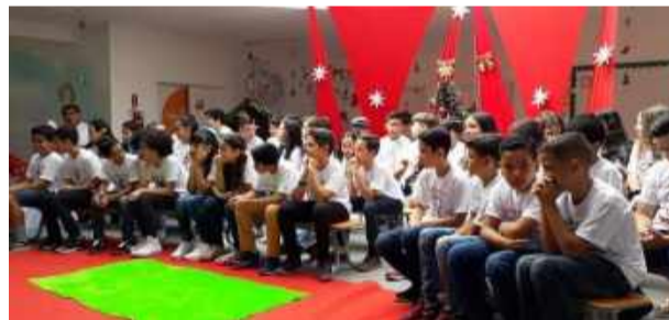
Alunos dos 5º anos da Escola Municipal Professora Célia Leonor Lopes Lunardini, em confraternização de Natal organizada na escola.