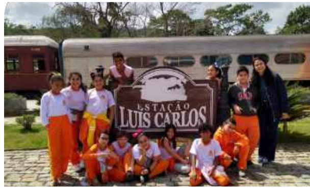
Parte dos alunos dos 5º anos da Escola Municipal Professora Eunice Leonor Lopes Prado, em dia de aula-passeio do Programa "Nos Trilhos do Saber".