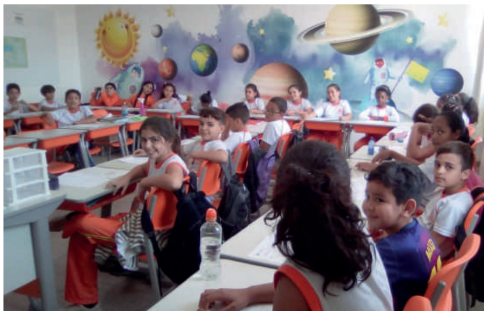
Alunos do 5º ano da Escola Municipal Prof. Dr. Domingos Lerário em sala de aula, espaço de grandes aprendizagens!