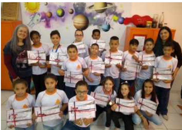
Alunos do 5º ano da Escola Municipal Prof. Dr. Domingos Lerario em sala de aula, espaço de grandes aprendizagens!