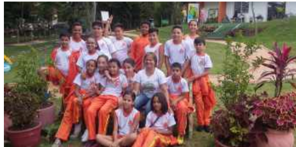
Parte dos alunos dos 5º anos da Escola Municipal Dom Alberto Johnnes Steeger, em passeio na Escola da Natureza Francisca Lerario.