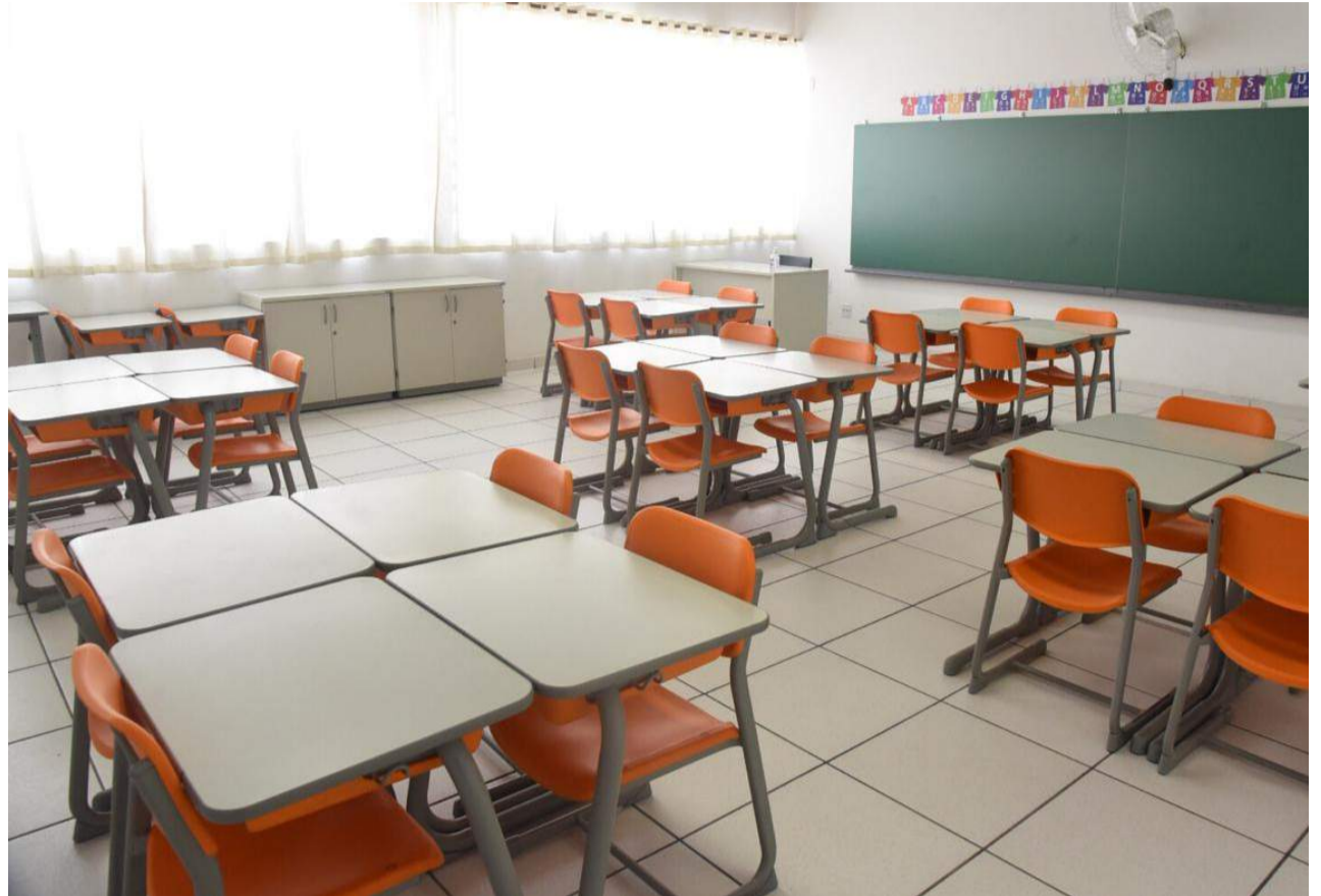
EMEI "Presidente Getúlio Vargas".