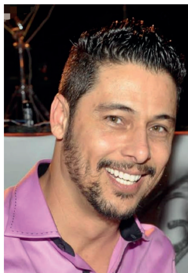
Deputado Federal Márcio Alvino (14/06)