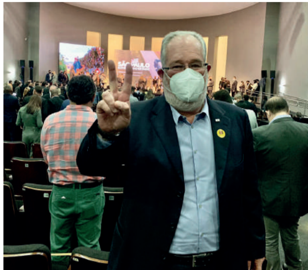
José Luiz Eroles Freire (Zé) Prefeito de Guararema

Melhorias serão executadas a partir da Igreja Nossa Senhora D'Ajuda e abrange dispositivos de acesso. Investimentos de aproximadamente R$ 4,3 milhões fazem parte do programa Novas Estradas Vicinais, do governo do Estado.