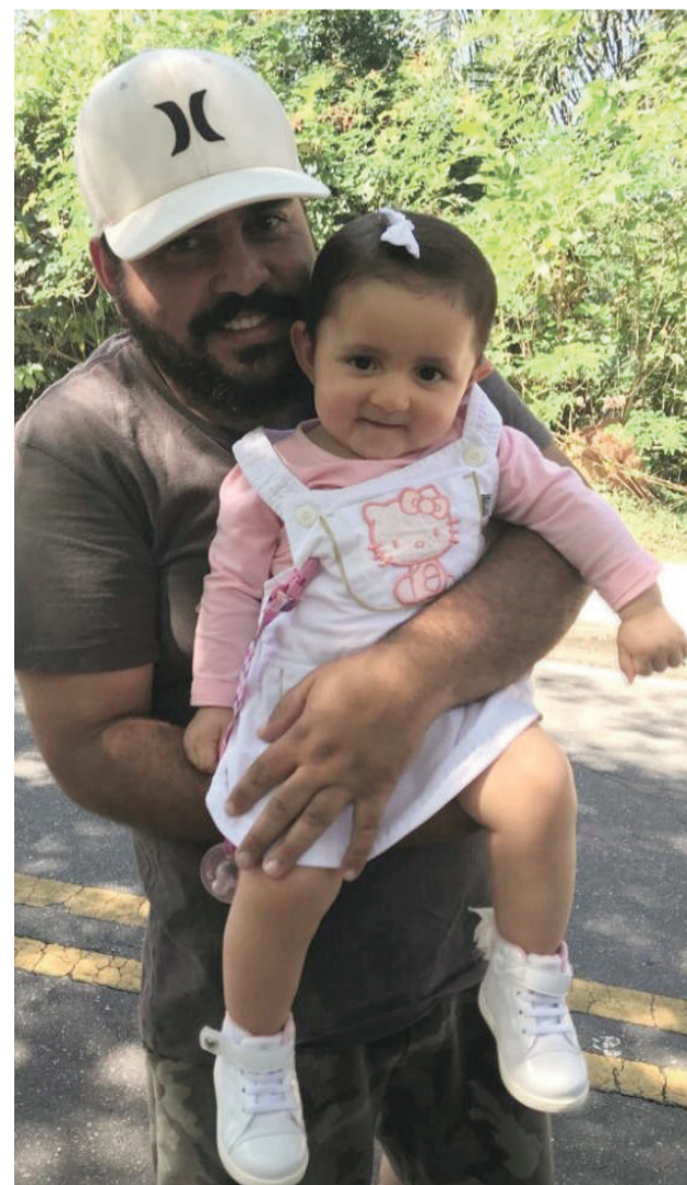
Um dos passeios mais divertidos do papai Neto Machado é levar a bonequinha Valentina para curtir a natureza.