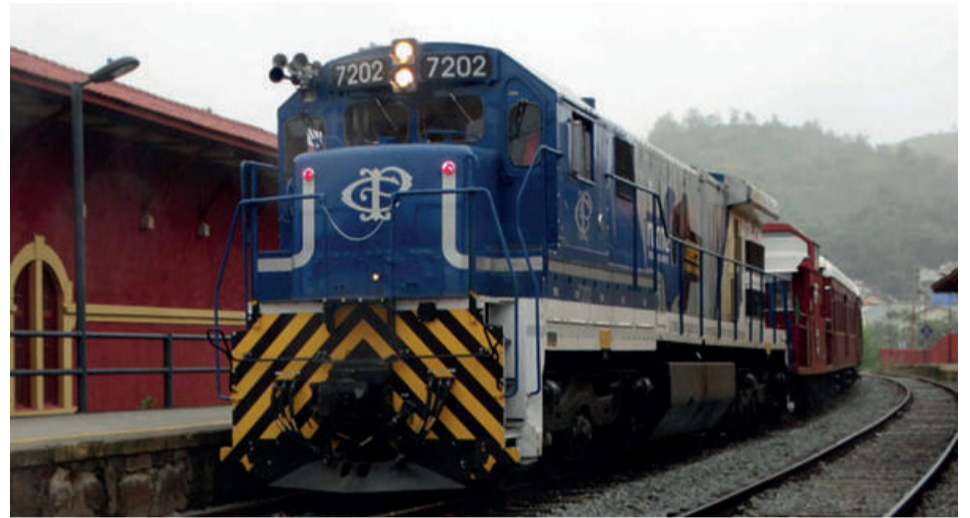
A locomotiva a diesel, também conhecida como Trem Azul, por sua cor, deverá ser utilizada durante a Halloween Party marcada para as 18 horas do próximo dia 30 de outubro, em Guararema

o passeio vai acontecer no Trem Azul, como vem sendo chamada a locomotiva à diesel, que está substituindo a antiga locomotiva do tipo Maria Fumaça, 353, a “Velha Senhora”, que está passando por reparos na oficina da Associação Brasileira de Preservação Ferroviária, na cidade de Cruzeiro, no Vale do Paraíba.