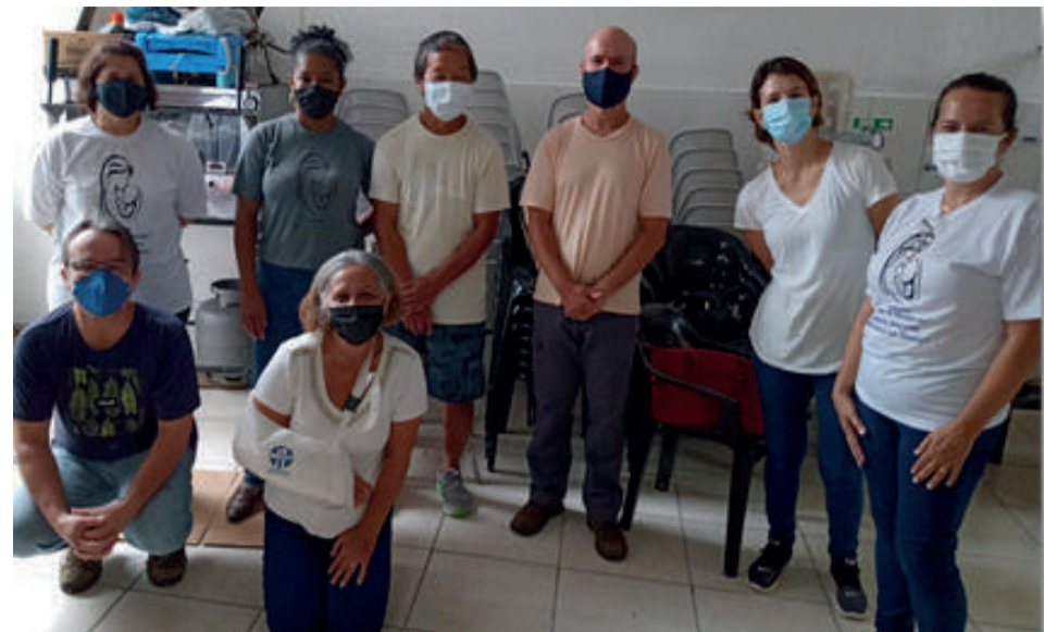
Parte da equipe de voluntários que fizeram a entrega das cestas de alimentos, mensalmente em domicílio às famílias acolhidas

As atividades desenvolvidas pelo Departamento de Assistência e Promoção Social Espírita “João dos Santos”, vem da força dos VOLUNTÁRIOS, que souberam compreender os ensinamentos de Jesus e dedicam suas vidas sob o lema: