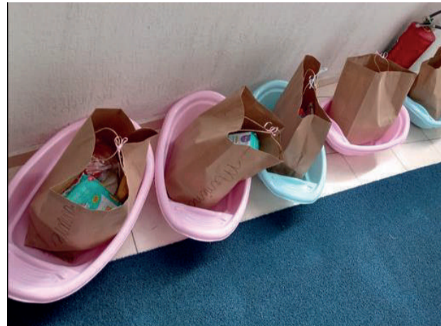
Cada enxoval com 30 peças, incluindo um kit higiene e banheiro

O quadro acima apresenta o total de atendimento geral por família. Média/mês de 56 gestantes, representando um total de 621 cestas entregues. A média/mês de não gestantes, em torno de 17 famílias, o que representou o total de 177 cestas entregues. Tivemos o atendimento de famílias em situação emergencial com necessidades básicas de alimentação, algumas encaminhadas pela Rede Socioassistencial. Destacamos que todas as famílias assistidas no ano, receberam uma cesta de Natal com mais 20 itens e com mais de 15 kg de mantimentos. Das gestantes assistidas, nasceram: 31 meninas e 27 meninos: média peso, 3.200 gr. e altura, 55 cm, sendo 14 partos normais e 44 cesáreas.