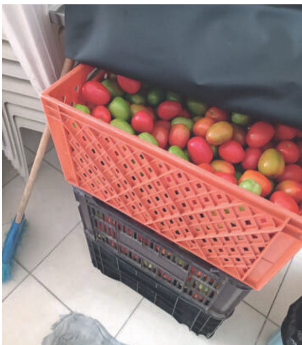
Houve a entrega de kit legumes, com aproximadamente 2 kg