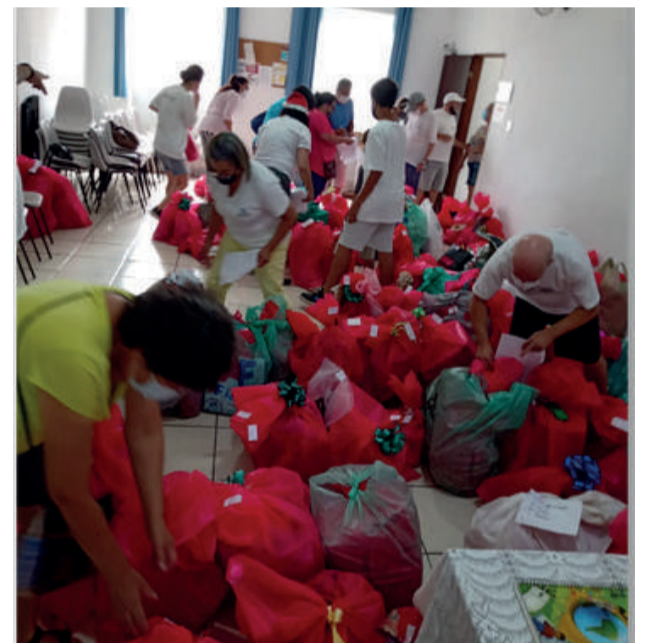
Equipe de voluntários separando os brinquedos de Natal para serem entregues com as cestas de Natal no domicílio das famílias acolhidas.

A Instituição acredita que com este trabalho as situações de vulnerabilidades e riscos sociais são combatidas, as famílias fortalecem seus vínculos, ficam mais felizes e capazes de levar uma vida independente e digna, valorizando sua família, sua vida e a do próximo. Este é o compromisso do Centro Espírita “Natalício de Jesus”, de responsabilidade social, de solidariedade e amor fraternal. Em nome de todos da Instituição, a Diretoria agradece muito a VOCE, que direta ou indiretamente ajudou demonstrando o seu