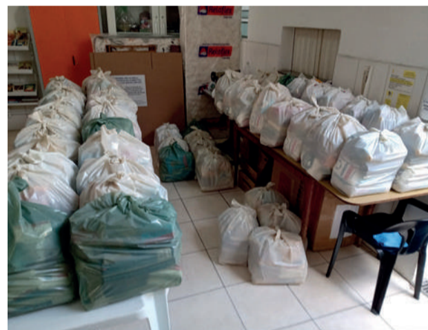
Cestas embaladas para entrega. Média/mês de 73 cestas

Cada enxoval com 30 peças, um kit higiene e banheiro. Foram distribuídos durante o ano. 395 brinquedos entre novos e seminovos, sendo 134 brinquedos novos. No Natal foram atendidas mais 273 crianças na faixa etária de zero a 10 anos, onde cada criança recebeu um brinquedo e um Kit higiene