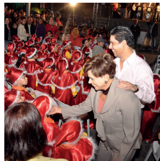
Cidade Natal foi idealizada em 2010, pelo ex-prefeito Marcio Alvino (atualmente deputado federal)