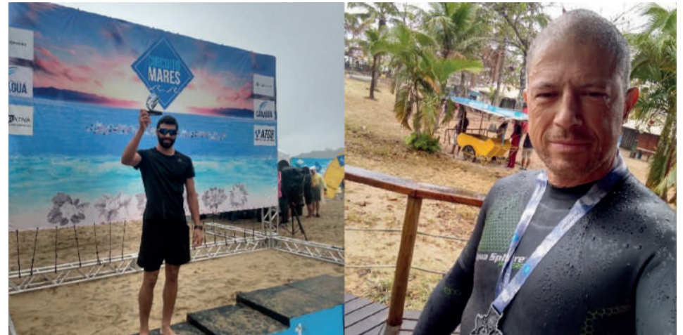
CIRCUITO MARES – ETAPA PRAIA DA COCANHA