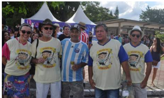
Bloco do Críde, cortejo terça - feira (21)