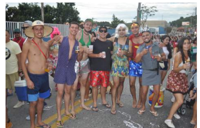
Bloco "Nós Sofre Mas Nós Goza" cortejo segunda - feira (20)