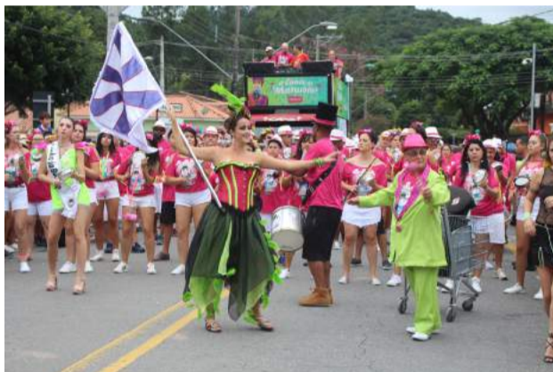
Bloco O Conde de Matutóia, Cortejo segunda-feira (20)