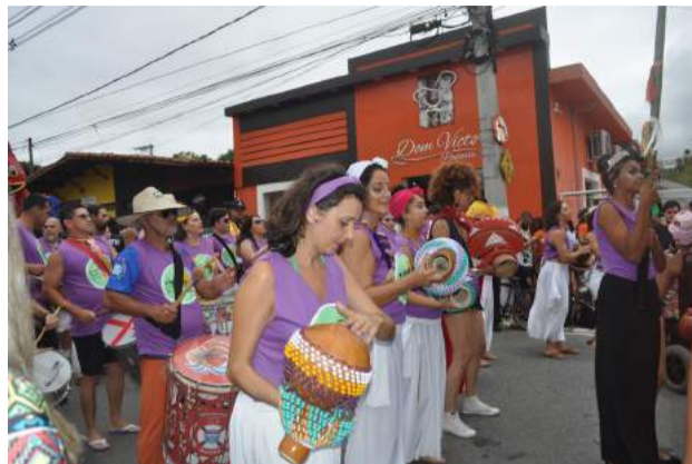
O Lindo Bloco do Amor, cortejo sábado (18)