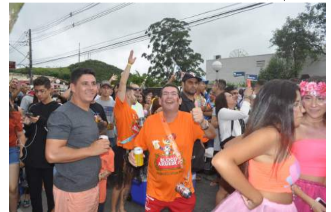
Bloco Arueira; cortejo domingo (19)