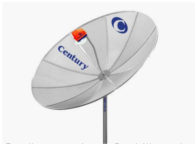
Foto ilustração. Antena Parabólica antiga

Acontece que as torres de 5G tem um alcance limitado e até o momento foram instaladas apenas nas capitais e em algumas cidades mais populosas, ou seja, esse sinal ainda não chega até a nossa região. As torres serão instaladas primeiramente em cidades grandes e depois em cidades menores de forma sucessiva até chegar a todas as cidades que fazem