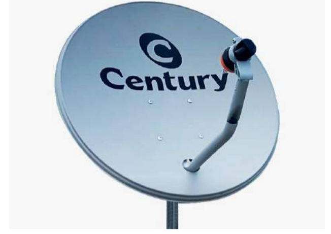
Nova Antena Parabólica

parte do plano de implantação até o ano de 2029. A data exata da chegada do sinal na região de Guararema ainda não foi definida, só é sabido que em janeiro deste ano a cidade já foi autorizada a implantar o sinal do 5G, e que agora depende do interesse de cada operadora de providenciar os equipamentos necessários e começar a transmissão.