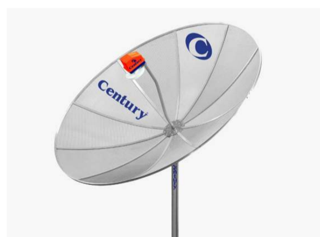
Foto ilustração. Antena Parabólica antiga

Acontece que as torres de 5G tem um alcance limitado e até o momento foram instaladas apenas nas capitais e em algumas cidades mais populosas, ou seja, esse sinal ainda não chega até a nossa região. As torres serão instaladas primeiramente em cidades grandes e depois em cidades menores de forma sucessiva até chegar a todas as cidades que fazem parte do plano de implantação até o ano de 2029. A data exata da chegada do sinal na região de Guararema ainda não foi definida, só é sabido que em janeiro deste ano a cidade já foi autorizada a implantar o sinal do 5G, e que agora depende do interesse de cada operadora de providenciar