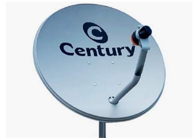
Nova Antena Parabólica

os equipamentos necessários e começar a transmissão.