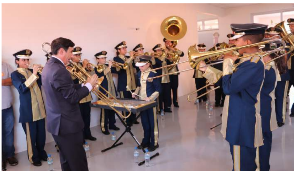
Banda Municipal de Guararema (Bamugua),