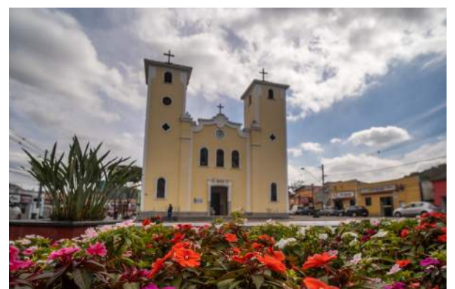
A peça encenação da Paixão de Cristo, é realizado pela Paróquia de São Benedito com apoio da Prefeitura de Guararema