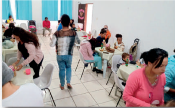
Festejando o Dia das Mães