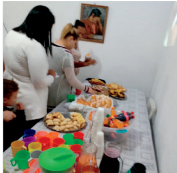
Mesa do Café do Dia das Mães