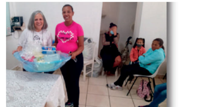
Entrega do Enxoval

entregues um enxoval novo e completo, com mais de 30 peças e uma banheira para cada gestante. As gestantes dos bairros distantes recebem o vale transporte