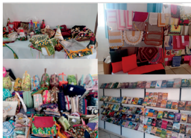
Feira do Artesanato e do Livro

RECURSOS HUMANOS: Os recursos humanos para a execução das atividades são totalmente realizados por voluntários. Atualmente, a Instituição possui aproximadamente cinquenta (50) voluntários, que se revezam nas diversas atividades do Departamento de Assistência e Promoção Social Espirita.