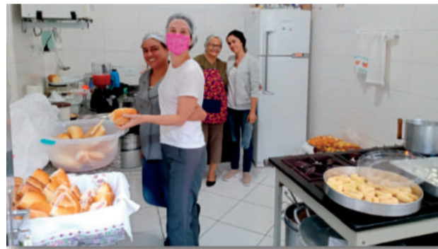
Preparando o café da manhã

RECURSOS FINANCEIROS: A captação de recursos financeiros para a manutenção, sustentabilidade e execução dos serviços de assistência, amparo, apoio e promoção social, tem sua origem nas doações dos mantenedores fixos e anônimos, bazar da pechincha, feira de artesanato e do livro, chá e jantar beneficente.