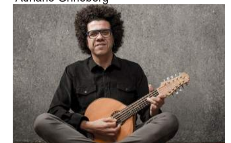
Hamilton de Holanda