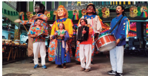
Grupo Bonecões de Mantiqueira