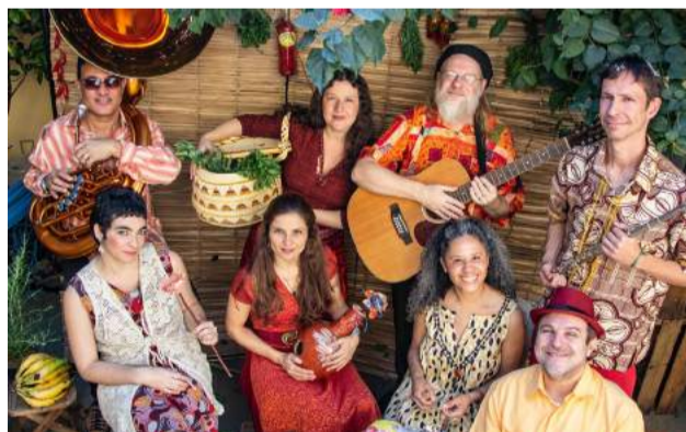
Cia. Cabelo de Maria

Encontro de Grupos Tradicionais, shows musicais e teatro: Guararema recebe atividades artísticas e culturais neste fim de semana, pelo 6º Festival de Arte Popular do Alto Tietê. É de graça, com classificação indicativa livre.