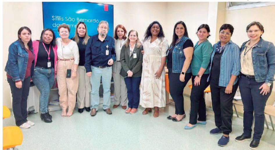
O encontro com profissionais de outra cidade proporcionou aos trabalhadores da Saúde de Guararema uma ampla visão sobre a doença.

"Foi uma troca de experiência muito positiva sobre a detecção precoce e o rápido tratamento da doença, o que reduz a disseminação dos casos de Sífilis Adquirida, Sífilis em Gestante e, por consequência Sífilis Congênita, evita danos irreversíveis e contribui para a saúde e o bem estar de toda a sociedade", avaliam os gestores municipais de Saúde de Guararema.