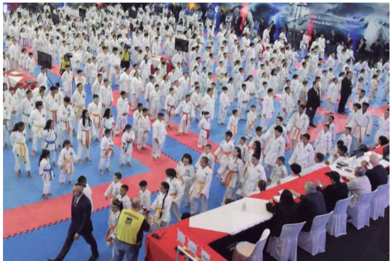
Parabéns também a todos os competidores e os organizadores do evento