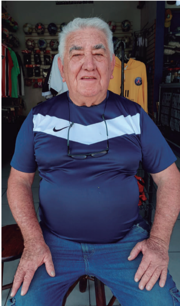
O famoso Ari está residindo em Guararema. Seja bem vindo!

Visitem o site: www.gazetadeguararema.com.br