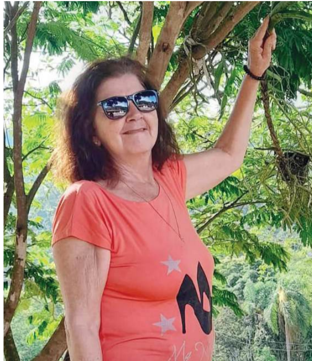
Lucia kayaki (23/01)