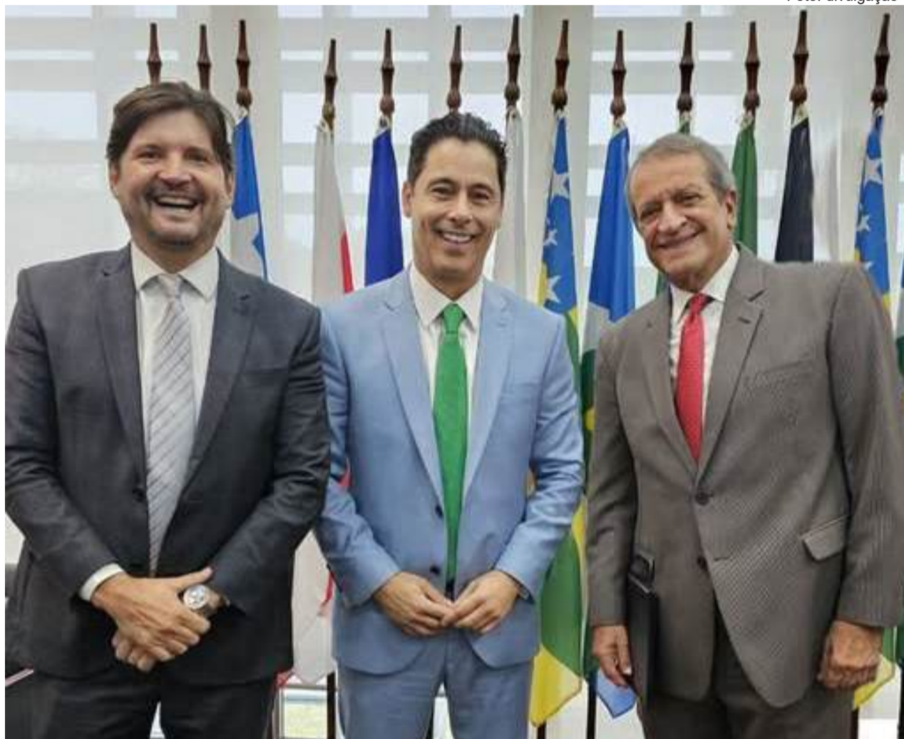
Deputado Estadual André do Prado (PL) Presidente da Assembleia Legislativa de São Paulo (ALESP), Deputado Federal e vice-presidente nacional do Partido Liberal Márcio Alvino (PL) e Valdemar da Costa Neto, Presidente nacional do PL

"Essa conquista é reflexo de seu compromisso, dedicação e trabalho incansável. Tenho certeza de que, ao lado do nosso presidente nacional Valdemar Costa Neto, você continuará honrando essa missão com muita seriedade e competência. Seguimos juntos nessa caminhada, fortalecendo o PL e trabalhando cada vez mais pelo Brasil e por São Paulo! Vamos em frente!"