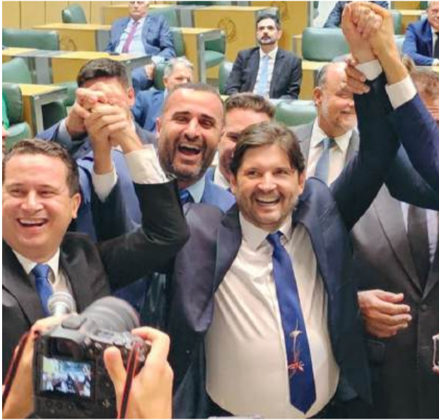
Deputado André do Prado foi reeleito presidente da Assembleia Legislativa do Estado de São Paulo (Alesp)

O deputado estadual guararemensense André do Prado foi reeleito, no dia 15/03 (sábado), presidente da Assembleia Legislativa do Estado de São Paulo (Alesp) para o biênio 2025-2027. Com 88 votos, ele recebeu ampla aprovação do Parlamento para dar continuidade ao trabalho iniciado em 2023.