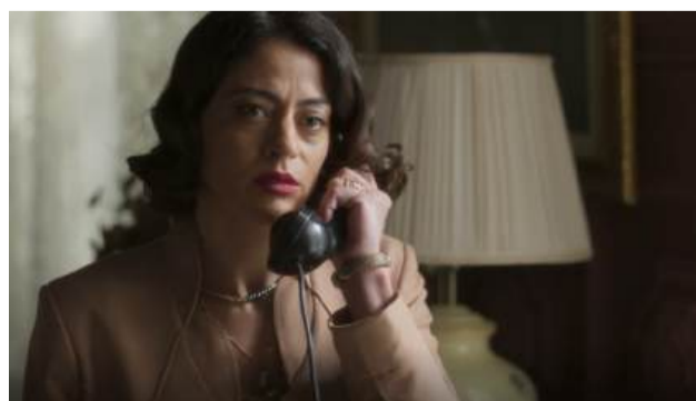
Clarice é presa por falsidade ideológica.