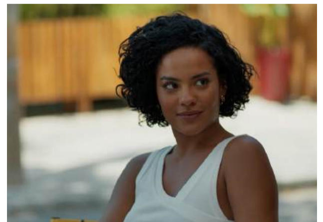
Fátima irá se aproximar de Afonso

Laís insiste para Cecília contar a Marco Aurélio que elas foram perseguidas por um carro. Odete pede a Consuelo um relatório de cada voo da TCA no Brasil. Celina fica impactada ao saber por Odete a situação da sua conta bancária. Leila demonstra a Renato sua insatisfação com a relação. Afonso e Maria de Fátima concordam em não ficar juntos enquanto ele namora Solange. Deise avisa a Laís que Cecília sofreu um grave acidente de carro. Odete invade a sala de Marco Aurélio e o coloca contra a parede.