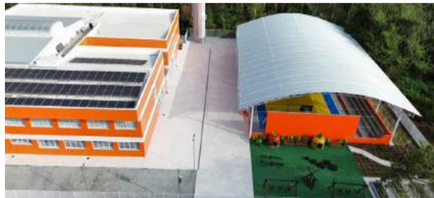
Nova Escola Municipal “Professora Consuelo Aparecida Tavares Neme”