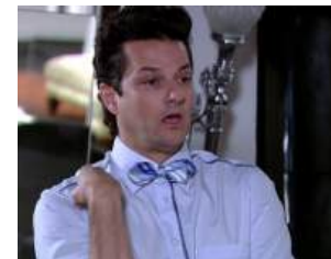
Ferette se surpreende com Crô em seu quarto

Ferette exige que retirem Crô de seu quarto. Paulinho procura Lígia, que o aconselha a falar com Gerluce. Misael aconselha Joaquim a se afastar de Arminda. Gerluce fica preocupada ao saber por Lígia que Paulinho sondou a mãe. Crô visita Kasper e João Rubens, mostrando seu interesse em comprar As Três Graças. Juquinha diz a Paulinho que a ficha de Joaquim é extensa. Vandilson deixa claro a Alemão que pretende ocupar o lugar de Bagdá na Chacrinha. Arminda surge com Helga na Chacrinha, convidando Raul e Joélly para irem a sua casa.