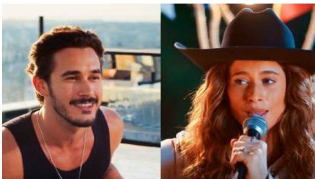
João Raul se declara para Agrado e canta com ela

João Raul se explica para seus fãs, e canta com Agrado, encantando a todos. Talita divulga o dueto de João Raul e Agrado, e Naiane se revolta. Malvino e Alaorzinho pensam em rescindir o contrato de trabalho com Ronei. João Raul exige que Ronei se afaste de sua vida pessoal. Naiane sofre nas redes